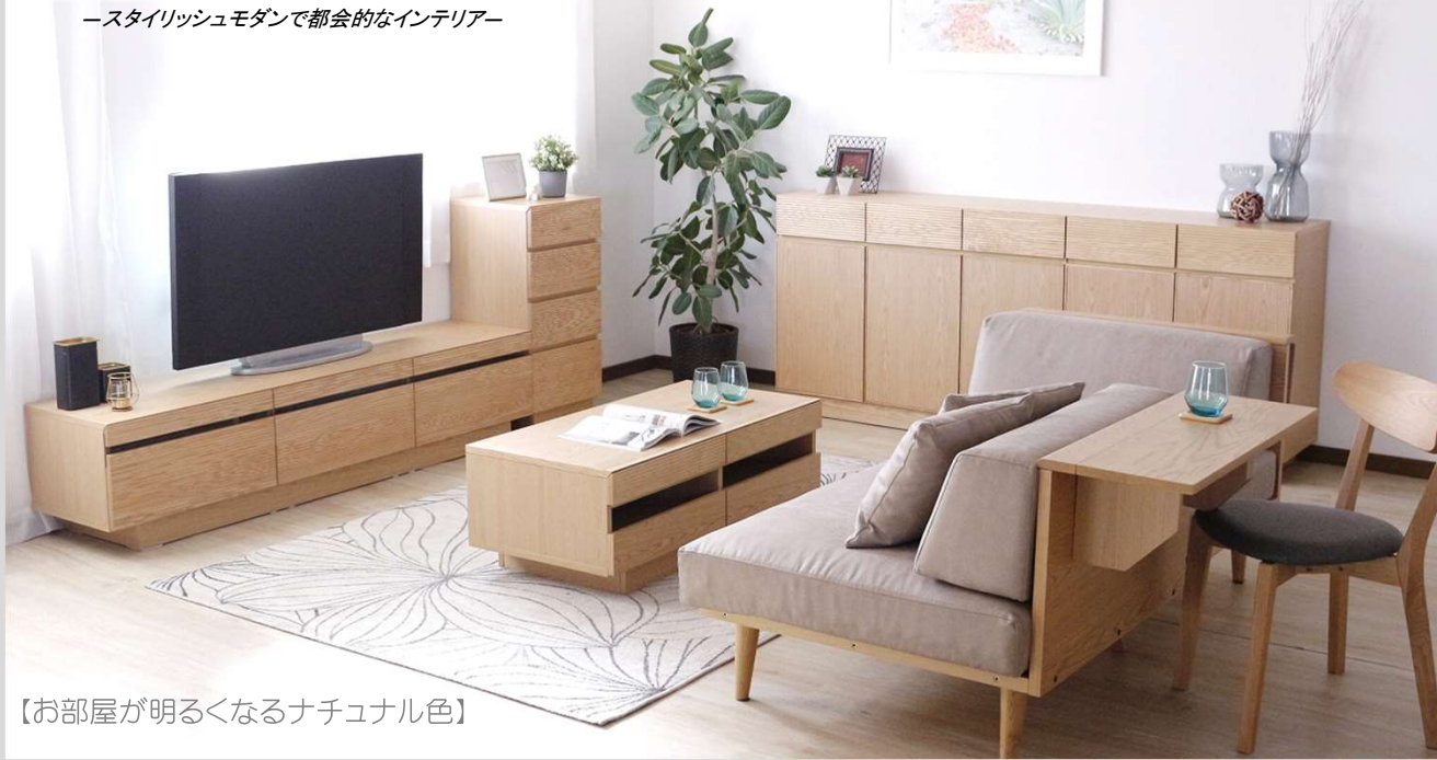
【お部屋が明るくなるナチュラル色】

高級感ある天然木の風合いを最大限に生かし、シャープでシンプルなデザインが特徴です。洗練された個性を放つ都会的なインテリアです。