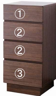
【 40チェスト 】