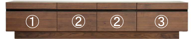
【 210TVホード 】