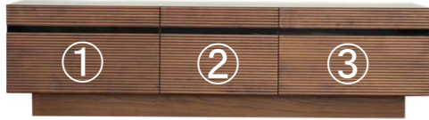
【 166TVホード 】