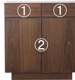
【 80サイドホード 】