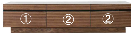
【 180TVホード 】