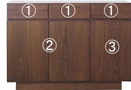
【 120サイドホード 】